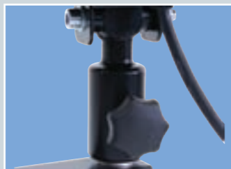
Aufnahmehülse nach DIN 14640 zur sicheren und universellen Befestigung auf Stativen und Brücken bedienbar.