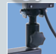
Aufnahmehülse zur sicheren und universellen Befestigung auf Stativen und Brücken