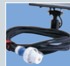
10 m Anschlussleitung und hochwertiger, druckwasserdichter Menekes-Stecker