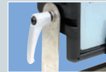
Sehr große stabile Metall-Spannhebel zur Einstellung des Abstrahlwinkels, perfekt mit Handschuhen bedienbar