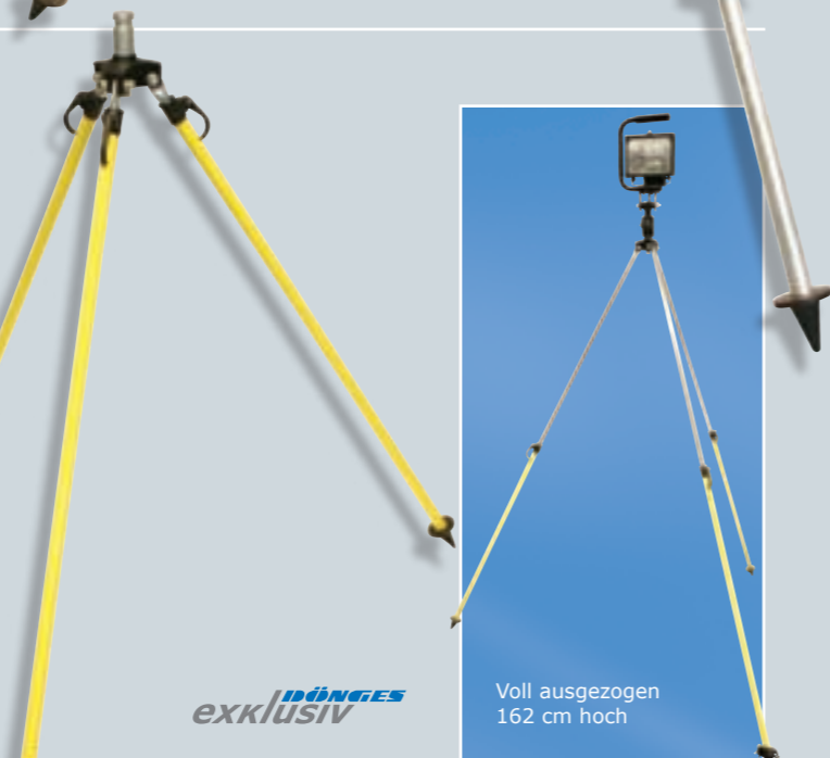
Voll ausgezogen 162 cm hoch