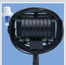
Die beiden Griffe sind auch zum Aufwickeln der Anschlussleitung geeignet