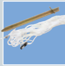
Abspannsatz ist im Lieferumfang enthalten und ist als Ersatz auch einzeln lieferbar