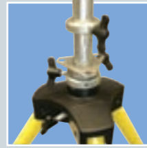
Damit die Rohre nicht verformt werden, benutzen wir ein spezielles, justierbares Klemmsystem