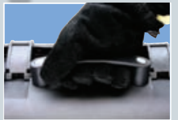
Großer bequemer Tragegriff, auch perfekt mit Handschuhen zu bedienen.