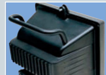
Stabiler, thermisch entkoppelter Alu-Handgriff auf der Rückseite - auch bequem mit Handschuhen bedienbar.